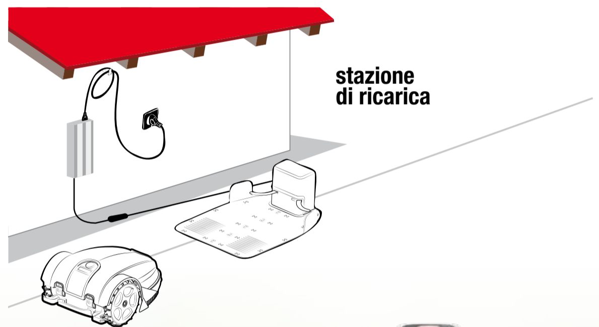
stazione di ricarica